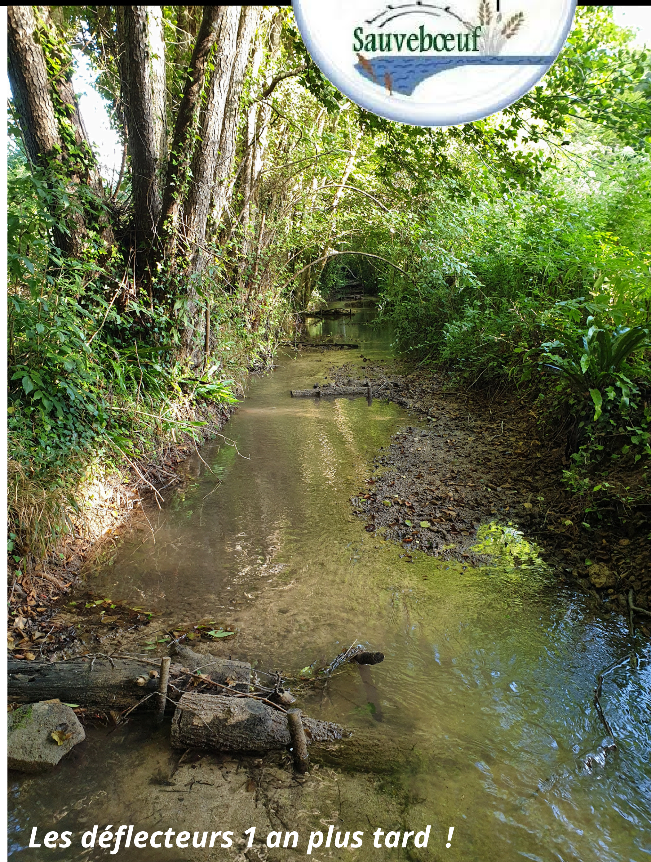
Les déflecteurs 1 an plus tard !